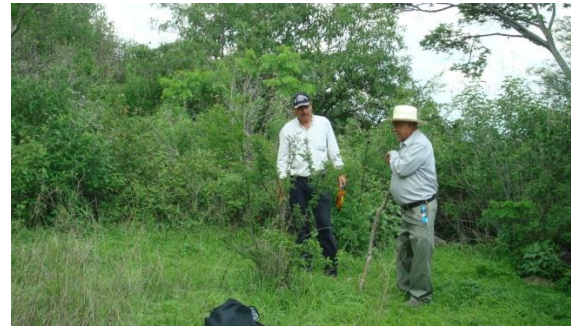
Figura 3. Participación de pobladores locales en el estudio. Yuriria, Guanajuato.

Para el reconocimiento de los usos múltiples de las especies, se realizaron encuestas personales a través de cuestionarios previamente diseñados, los cuales contenían preguntas definidas y orientadas a los propietarios de terrenos con vegetación nativa o deforestados (Ramírez y García, 2000). Entre las preguntas destacan nombres comunes de las especies, parte(s) de la planta utilizadas, usos primarios, forma de utilización, época de uso y medidas de conservación de las especies.