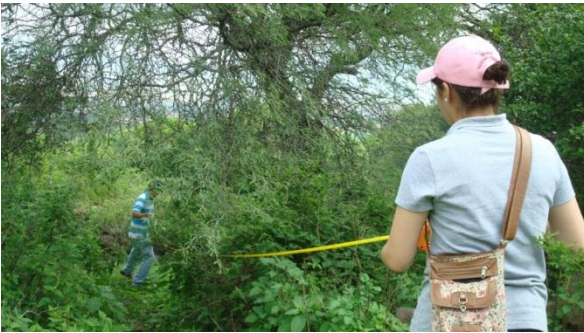
Figura 2. Delimitación del área de estudio en el paraje del cerro de Guariaco. Yuriria, Guanajuato.