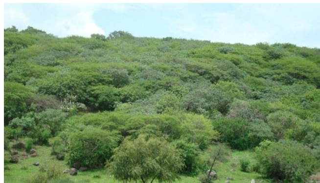
Figura 5. Vegetación típica del sureste de Guanajuato en época de lluvias.

El muestreo de las especies se realizó en los meses de julio y agosto, época positiva para la manifestación del crecimiento de la vegetación en respuesta a la época de lluvias (Figura 5).